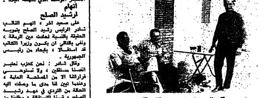
السيد في منزله (بدمشق)

السيد في منزله (بدمشق) السيد في منزله (بدمشق) السيد في منزله (بدمشق)